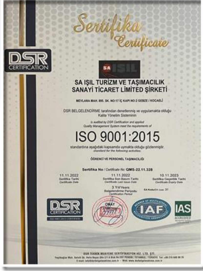
ISO 9001:2015 Kalite Yönetim Sistemi Sertifikası