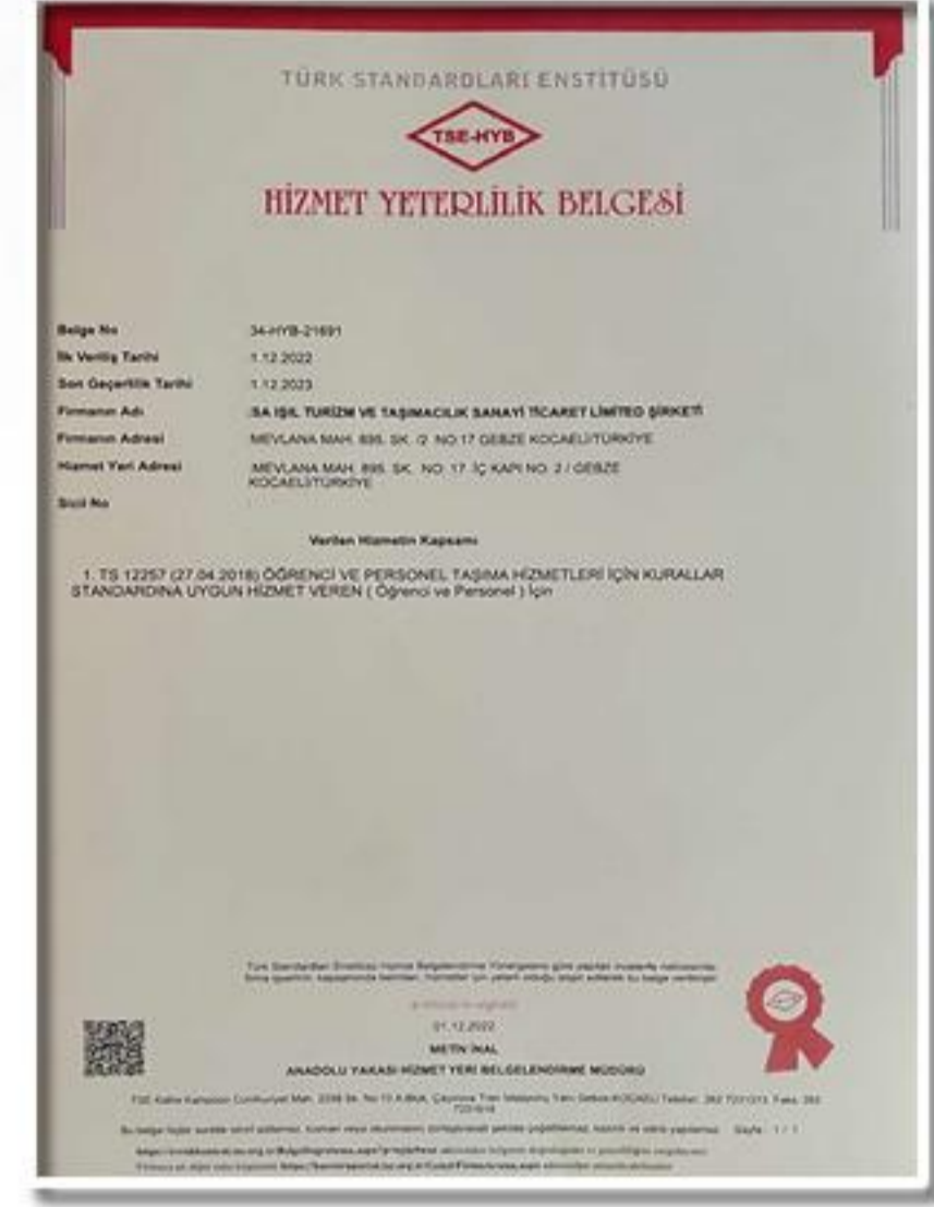
Hizmet Yeterlilik Belgesi