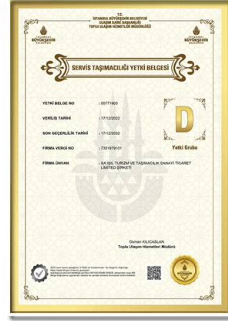
Servis Taşımacılığı Yetki Belgesi