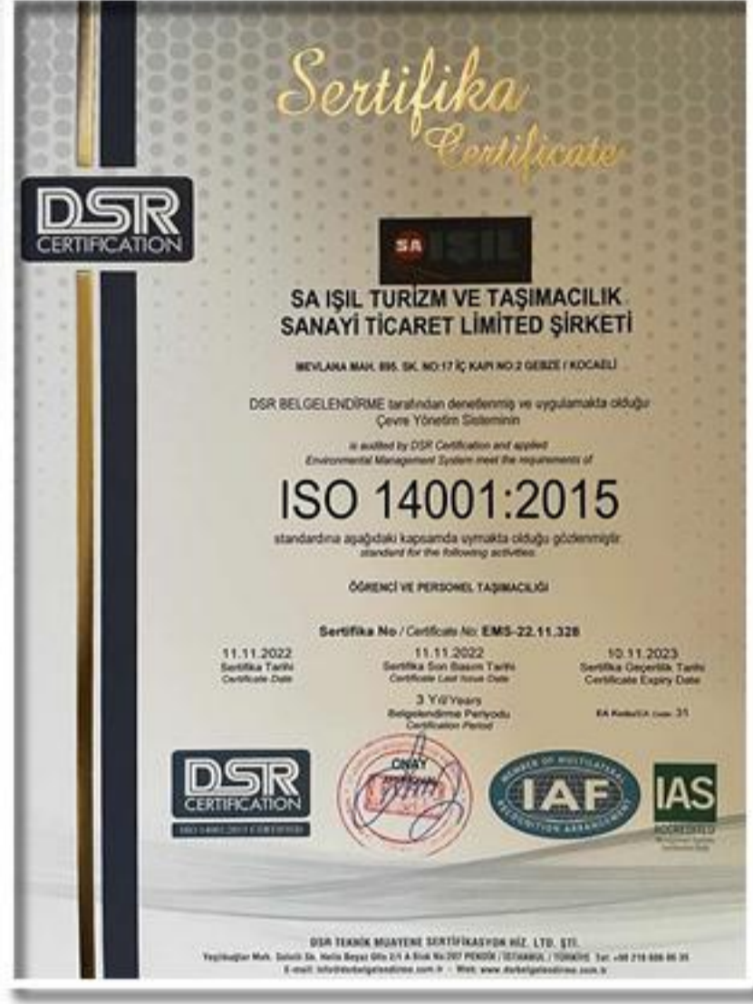
ISO 14001:2015 Çevre Yönetim Sistemi Sertifikası