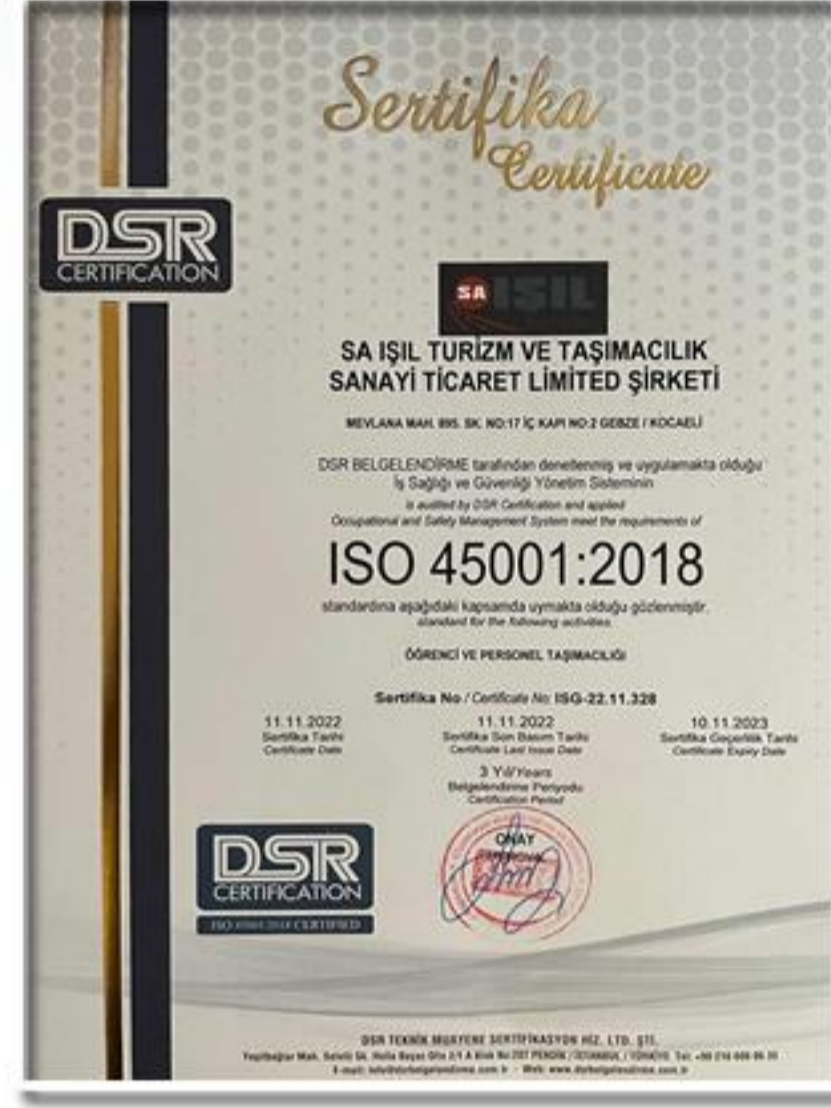
ISO 45001:2018 İş Sağlığı ve Güvenliği Yönetim Sistemi Sertifikası